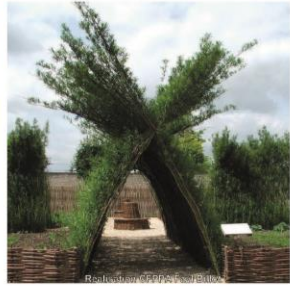
► L'osier et la possibilité de créer des structures vivantes ludiques