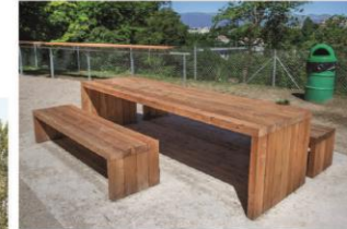
► Des tables de pique-nique en bois brut adaptées aux PMR