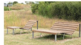
► Des assises pour s'allonger et profiter pleinement du cadre