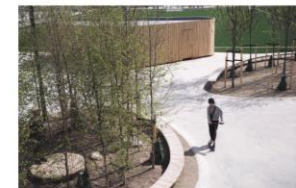
► Des assises et des îlots de végétation intégrés à la structure du skate-park