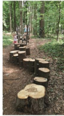
► Des jeux avec des matériaux bruts comme le bois pour une meilleure intégration paysagère, le ré-emploi de matériaux tels que des troncs peuvent être envisagés