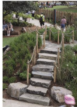
► Les talus comme supports d'espaces de jeux